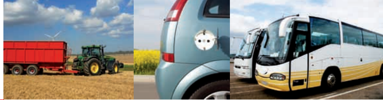
Elektrische Sicherheit in Elektro- und Hybrid-Fahrzeugen